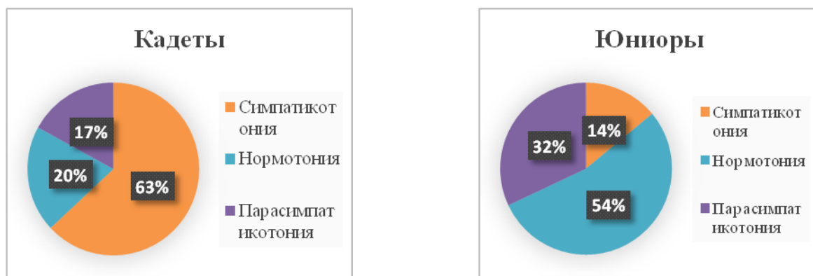
Рис. 1. Соотношение спортсменов, специализирующихся в легкой атлетике по типу нервной регуляции

Среди юниоров велогонщиков ваготония наблюдается в 18 % случаев, тогда как у кадетов этот показатель составил всего лишь 10%. При анализе полученных результатов ВИК у спортсменов велоспорта было установлено, что среди кадетов симпатикотония наблюдается у 58%, у юниоров- 23% (рис. 2) Показатель нормотонического типа регуляции НС в обеих группах распределился не одинаково (кадеты - 34%, юниоры 59%).