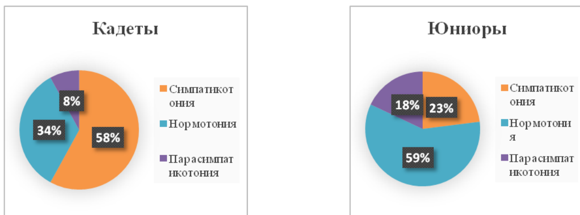
Рис. 2. Соотношение спортсменов, специализирующихся в велоспорте по типу нервной регуляции