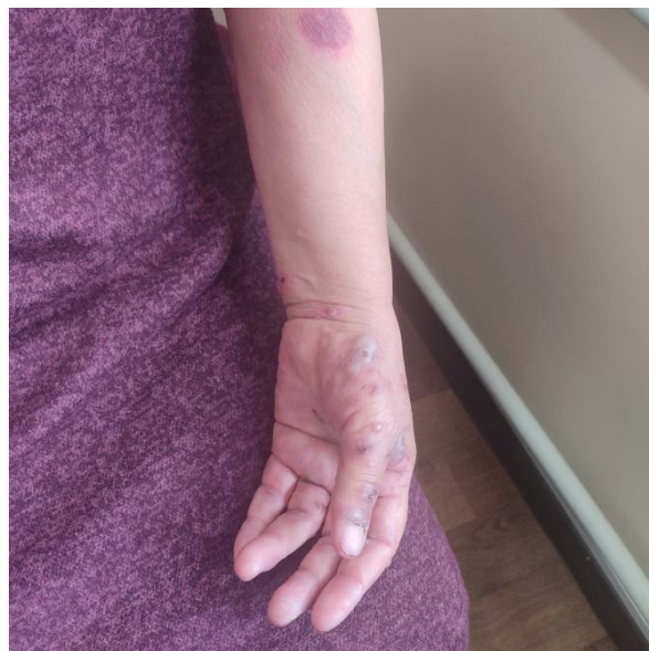
Рис. 3. Эритематозные высыпания с поражением кожи и слизистых