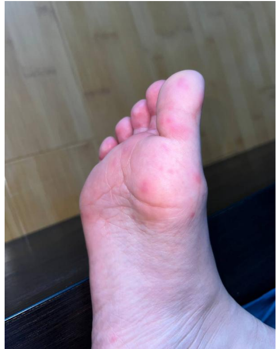
Рис. 1. Эритематозные высыпания с поражением кожи