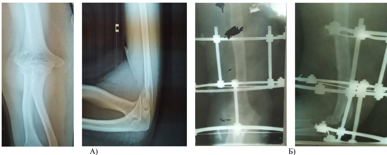
Рис. 1. Закрытый компрессионно -дистракционный остеосинтез с помощью аппарата Илизарова. А) Предоперационные рентгеновские снимки. Б) Послеоперационные рентгеновские снимки

При оскольчатых и внутрисуставных переломах дистального конца плечевой кости у больных применяли открытый остеосинтез реконструктивными пластинами и открытый остеосинтез пластиной с угловой стабилизацией. (рис. 3).