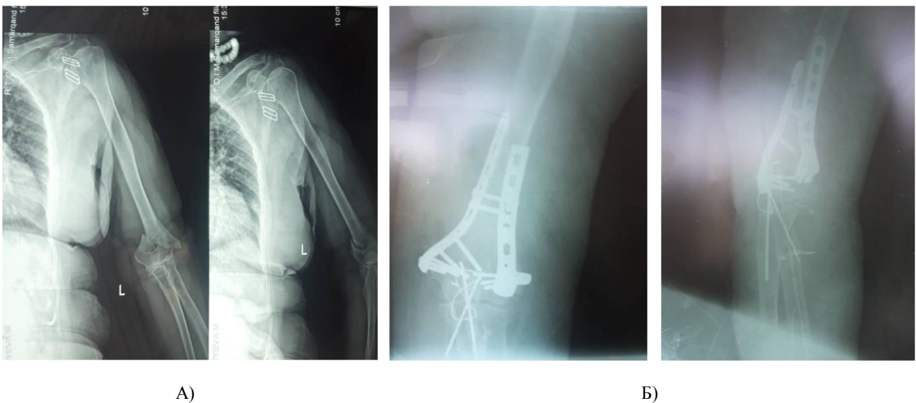
Рис. 3. Открытый остеосинтез реконструктивными пластинами и открытый остеосинтез угловыми стабилизирующими пластинами. А) Рентгенограммы до операции. Б) Рентгенограммы после операции

Для открытой репозиции костных отломков использовали следующие методы: задний через локтевой отросток (transolecranon), наружно-латеральный, внутренне-латеральный и 2 одновременных разреза наружно-латеральный и внутренне-латеральный.