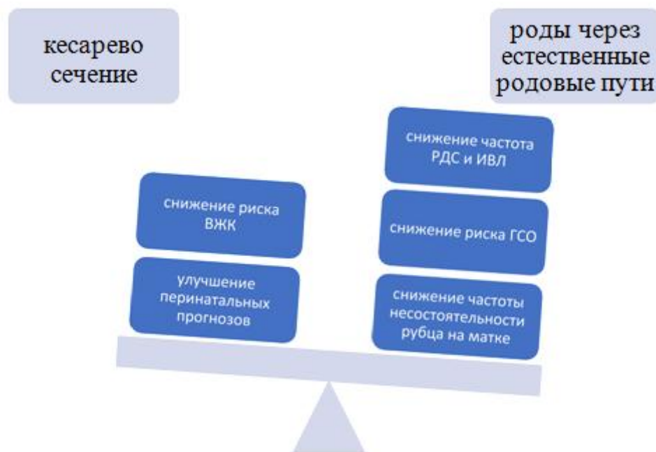
Рис. 1. Преимущества разных методов родоразрешения при преждевременных родах

ных родов через естественные родовые пути приводят следующие аргументы: у рожденных через естественные родовые пути недоношенных детей ниже частота респираторных проблем, и они реже нуждаются в проведении ИВЛ [12]. Кесарево сечение связано с повышенным риском РДС плода, потому что для созревания легких у новорожденных необходимы гормональные и физиологические изменения, связанные с родами [7].