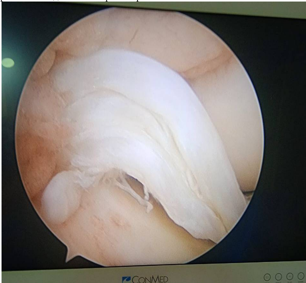
Расм 1.Бемор К.М. 1996й. Кас.тар №186. Операциядан олдин: Ўнг тизза бўғими ички мениски “ручка – лейко” типида жароҳати

Ўз иш фаолиятимиздан мисоллар келтирамыз: