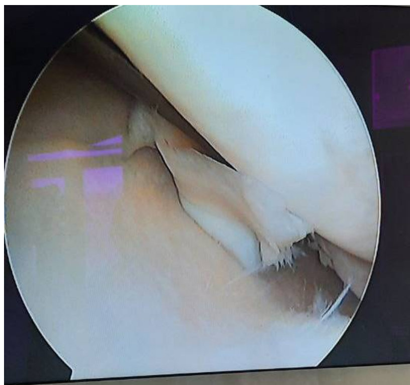
Расм 3. Бемор Т.С.,1991й. Кас.тар 174 операциядан олдин: Ўнг тизза бўғими ички мениски лахтаксимон типда эскирган жароҳати.