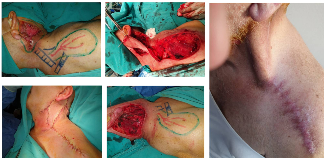
Рис. 2(а-г) широкое иссечение опухоли и одномоментная пластика супраклавикулярным кожно-фасциальным лоскутом; 2(д) вид раны после заживления.

калечащего характера предлагаемого лечения. Местно – на коже левой заушной области изъязвленное новообразование размерами 5х6см. При МРТ – новообразование кожи с прорастанием в подкожную клетчатку левой латеральной поверхности шеи, спаянная с кивательной мышцей и платизмой. Прорастание к подлежащей костной структуре не выявлено, лимфатические узлы шеи интактны. Цитология: плоскоклеточный рак. Установлен клинический диагноз: рак кожи левой боковой поверхности шеи. T 4 N 0 M 0 , III стадия, II клиническая группа. Была проведена операция – широкое иссечение опухоли тканей этой области с сохранением ветвей лучевого нерва, одномоментная пластика. Метод закрытия дефекта – супраклавикулярный кожно-фасциальный лоскут (рис. 2 а-д).