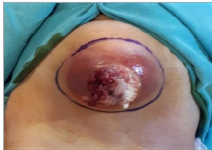
рис. 1а, опухолевое образование на коже подбородочной области