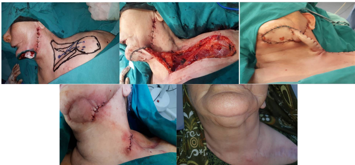
Рис. 1(б-г) реконструкция дефекта васкуляризованным кожно-фасциальным супраклавикулярным лоскутом; 1(д) второй этап операции, иссечение ножки; 1(е) вид пациента через 6 месяцев после операции.

подбородочной области с сохранением маргинальной ветви лицевого нерва, левосторонняя селективная шейная диссекция. Одновременно выполнена реконструкция дефекта васкуляризованным кожно-фасциальным супраклавикулярным лоскутом (рис. 1 б-е).