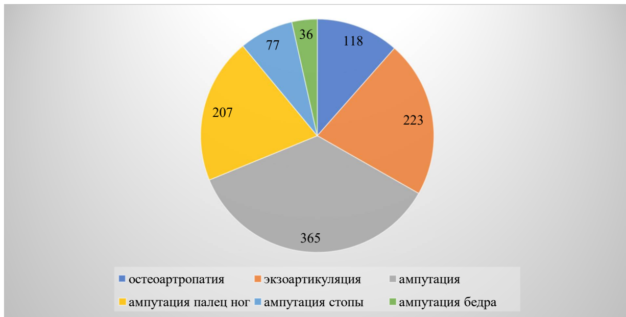
Рисунок 2. Частота встречаемости различных форм диабетической стопы за 6 месяцев 2021года.

Из 2445 зарегистрированных больных остеоартропатия встречалась у 118 (4,82%) больных, из них женщин 41 (34,7%), экзартикуляция у 223(9,12%) больных (в том числе у 96 (43%) женщин), ампутации у 365 (14,9%), больных, 104 (28,49%) из которых составили женщины, ампутация палец ноги в 207 (8,46%) случаях, 46 (1,88%) из них составили женщины, ампутация стопы у 77 (3,14%) больных, 20 (0,8%) из которых составили женщины. Ампутация бедра было в 36 (1,47%) случаях, 16 (0,6%) из них составили женщины.