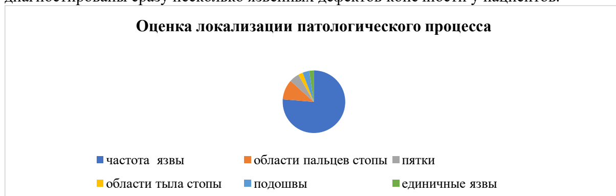
Рисунок 1. Оценка локализации патологического процесса

Оценка локализации патологического процесса показала, что с наибольшей частотой язвы формировались у 503 человек (20,57%) (в том числе женщин 138 (27,4%)), из них в области пальцев стопы 68 (49,3%), пятки 34 (24,6%), тыла стопы 15 (10,8%) и подошвы 23 (16,7%). Единичные язвы конечностей встречались достоверно чаще, но в 16 (11,59 %) случаев диагностированы сразу несколько язвенных дефектов конечности у пациентов.