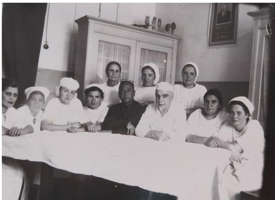
Рис. 5. Сотрудники урологической клиники (1951г)