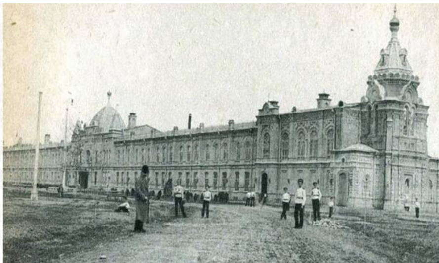
Рис. 1. Кадетский корпус, где был расположен институт (1920)