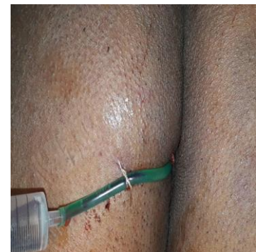
Рис. 9. Гидропрессивные промывание гнойной полости озонированным раствором