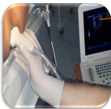
Рис. 7. Определение локализации гнойной полости под контролем УЗИ