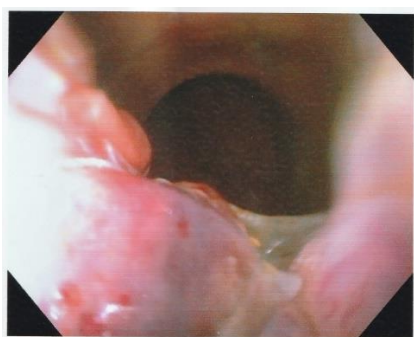
Рис. 1. Больной П. 47 лет. RRS выявлен инфильтративный отек на задней стенке прямой кишки при ретроректальном остром парапроктите

В основной группе больных, с целью уточнения расположения гнойной полости,