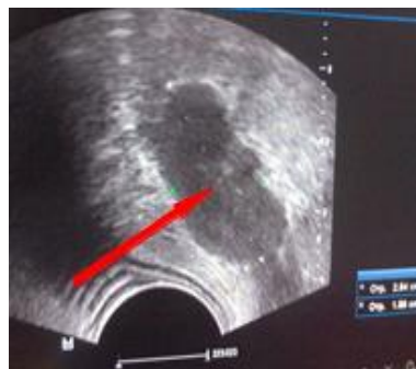
Рис. 2. Больной К. 52 года. Эндоректальная сонография: Имеется жидкостное образование в ишиоректальной области