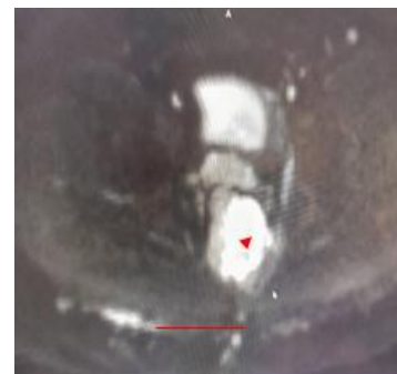
Рис. 3. МРТ пациент А. 1979г.р. МРТ: аксиальный срез, затёк в правом ишиоректальном пространстве. гиперинтенсивный сигнал от гнойной полости