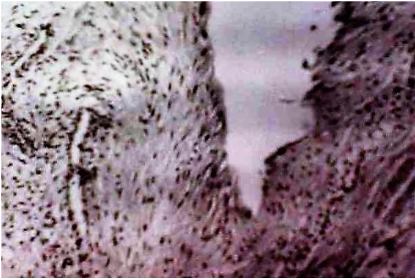
Рис. 3. Выраженная изрезанность микрорельефа с десквамированным эпителием слизистой оболочки внутренней поверхности кисты. СЭМ x 400