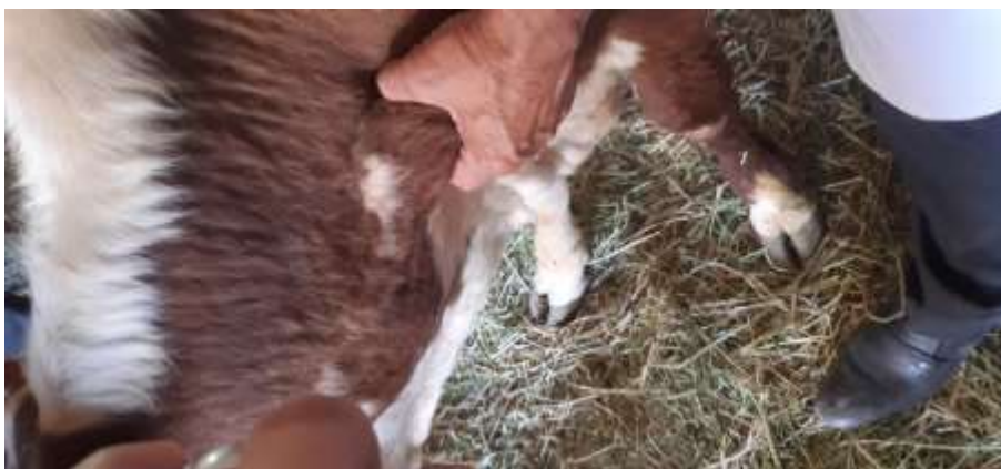
Расм 2. Тейлерияз билан касал молни курак олди лимфатик тугунларини 4-5 баробар катталашуви