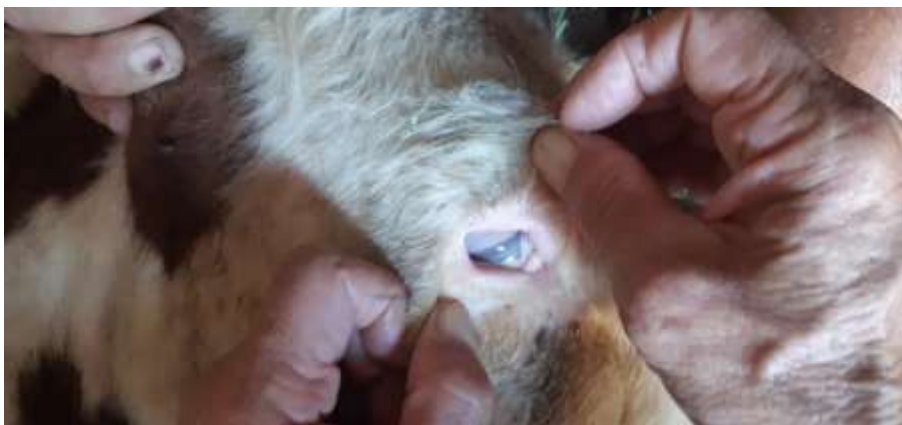
Расм 1. Тейлерияз билан касал молни кўз шиллик пардаларидаги анемия, инфилтрация ҳолатлари

спонтан касал молдан олинган қон билан териси остига 10 мл дан юбориб юктирилди. Тадқиқотдаги молларда ҳар куни клиник ва паразитологик текширишлар олиб борилди. Олиб борилган тадқиқотлар натижасида юктиришдан кейинги дастлабки 17-18 кунлари ҳар учала гуруҳ молларида ҳам тана ҳароратини 40,8-40,9^{\circ}\text{C} гача кўтарилиши ва ундан кейинги 3-4-кунлари тана ҳароратининг 41,5^{\circ}\text{C} гача кўтарилиши, организм беҳоллашуви, ташқи лимфатик тугунларини 4-5 баробар катталашуви иштахани йўқолиши ҳамда қавш қайтаришни сусайиши, кўриниб турган шиллик пардаларида анемия, инфилтрация ҳолатлари (1-2-расмлар) кузатилди.