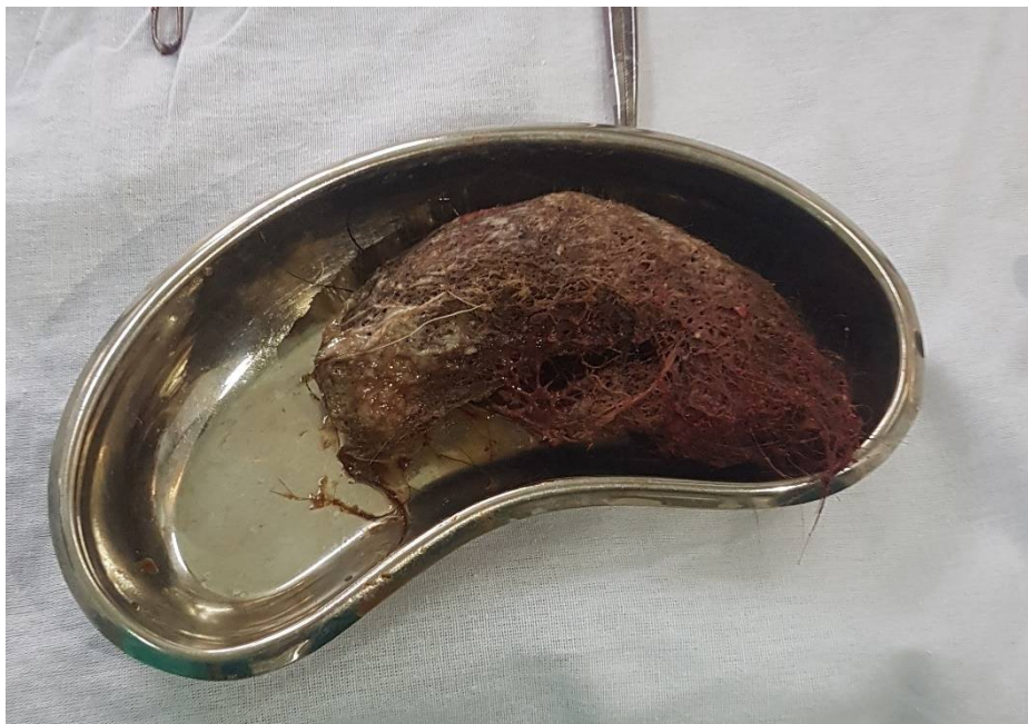
Расм-1. Ошқозондан олинган трихобезоар.

Беморга эндоскопик йўл билан трихобезоарни олиб ташлашга ҳаракат қилинди иложи бўлмади шу сабабли 24.12.2018 йил санаси Лапаротомия, гастротомия ва ёт жисимни олиб ташлаш операцияси амалга оширилди. Ошқозон очилганда ўлчами 11,0x9,0 см бўлган соч ва жун тутамидан иборат трихобезоар олиб ташланди (Расм – 1).