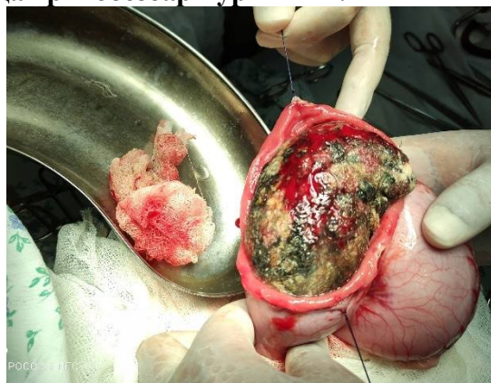
Расм – 4. Трихобезоар. Ошқозон очилгандаги ҳолат.