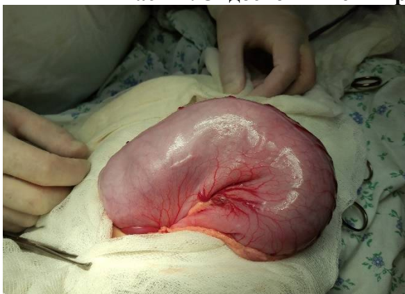
Расм – 3. Лапаротомияда ошқозонни кўриниши.