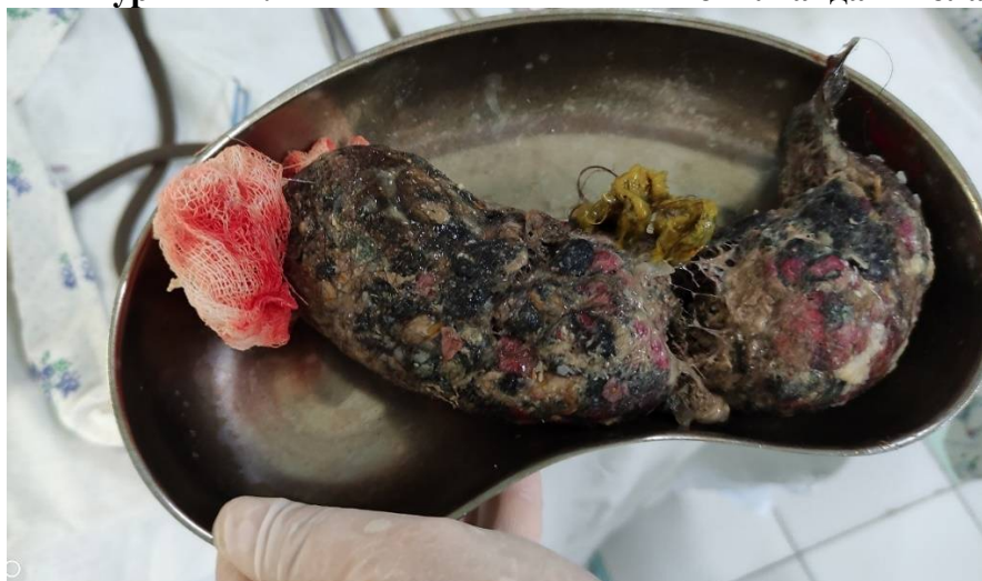
Расм – 5. Ошқозондан олинган трихобезоарнинг умумий кўриниши.