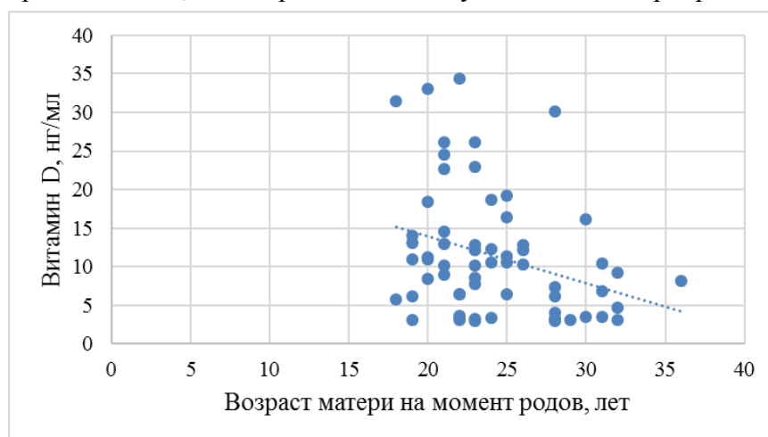
Рис. 1. Корреляционная связь уровня витамина D и возраста матери на момент родов.

С целью статистического изучения связи между перинатальными явлениями и развитием гипертиреоза у детей нами был высчитан коэффициент ранговой корреляции Спирмена (таблица 3). Выявлена достоверная умеренная прямая сила корреляционной связи между паритетом матери и сроком развития гипертиреоза у детей (r=0,3, p=0,001). Уровни ТТГ, тиреоидных гормонов и АТ-рТТГ у детей с гипертиреозом не имели достоверную корреляционную связь с анамнезом жизни ребенка. Однако выявлена обратная корреляционная связь между АТ-ТПО у детей с гипертиреозом и оценкой по шкале Апгар у детей на 1-ой (r=-0,3, p=0,01) и 5-ой (r=-0,2, p=0,03) минутах жизни умеренной и слабой силы. Таким образом, можно предположить, что тиреоидный статус детей с гипертиреозом не зависит от