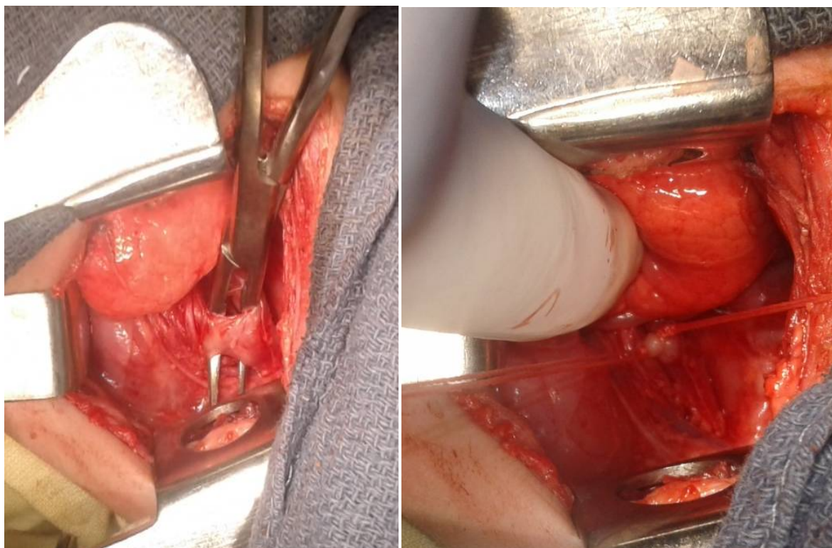
2-расм Операцион босқичлари.

Текширувлар натижасида, барча касалхонага ётқизилган беморларнинг 3 нафариди (2 нафари 1 ойгача ва 1 нафари 6 ойлик ёшида) тугма трахэзофагиал оқма тасдиқланган. Оператсия олди тайёргарлик комплекси аспирацион пневмонияни даволашни (кислородли терапия, антибактериал ва инфузион терапия), витаминли терапияни, овқатланишни қўллаб-қувватлашни, умумий мустаҳкамловчи даволашни ўз ичига олади. Оғиз орқали озиклантириш назогастралзондни ўрнатиш орқали тўхтатилди, у орқали найча билан озиклантириш амалга оширилди. Ҳолати барқарорлашгандан сўнг, аспирацион пневмония белгилари пасайгандан сўнг, беморларда тугма нуқсонларни жаррохлик йўли билан коррекциялаш амалга оширилди. Операция ўнг томонлама торакотомия йўли билан амалга оширилди, оқма йўли эксплеврал жойлашган, иккинчиси атрофдаги тўқималардан ажратилган ва иккита бир-бирига ўрнатилган лигатуралар ўртасида кесишган, 2 беморда оқма йўли диаметри 0,5 см дан ошмаган ва биттасида 1,0 см булган, барча ҳолларда оқма трахеянинг бифуркацияси жойида қизилўнгач билан алоқа қилган. Кўкрак бўшлиғи тикилган ва Бюлау бўйича пассив дренаж билан дренажланган (2-расм).