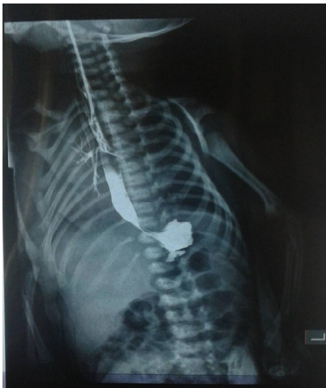
Расм.1 Ўнг ўпкага олиб борувчи трахеоэзофагеал оқма

МАТЕРИАЛЛАР ВА МЕТОДЛАР. 2016 йилдан 2021 йилгача бўлган даврда СамМИ 2-клиникасига 9 нафар бемор туғма изоляцияланган трахеоэзофагеал оқмага шубҳа билан госпитализатсия қилинган. Анамнздан уларнинг барчаси туғилгандан бери тез-тез шамоллаш билан оғриган. Асосий шикоятлар, онасининг сузидан, йўтал, нафас қисиш хуружлари, периорал цианоз ва тана ҳароратининг даврий кўтарилиши булган. Беморларнинг ёши янги туғилгандан 1 ёшгача бўлган, беморларнинг кўпчилиги 7 (77,8%) 3 ойгача бўлган. Текширув мажмуаси умумклиник методлардан ташқари, ўпка рентгенограммаси, эзофагоскопия ва қизилўнғачни сувда эрувчан контраст моддадан фойдаланган ҳолда рентгенологик текширишни ўз ичига олади (1-расм).