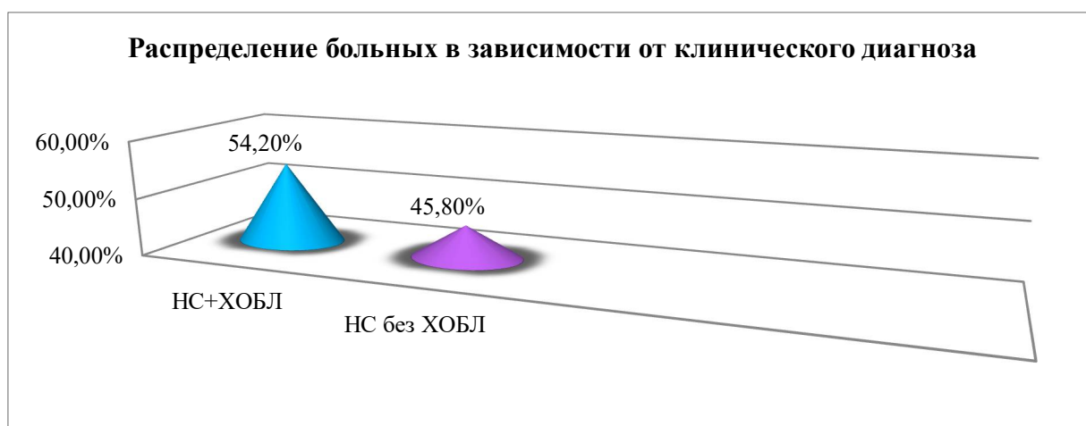
Рис. 1. Распределение больных по группам в зависимости от клинического диагноза

Материалы и методы. В исследование были включены 120 больных с ИБС нестабильной стенокардией напряжением, госпитализированных в отделениях экстренной терапии №1 и 2 Самаркандского филиала РНЦЭМП. В зависимости от клинического диагноза больные были разделены на 2 группы. В 1-ю группу вошли 65 больных с НС и ХОБЛ 2-3 ст., во 2-ю группу вошли 55 больных с НС без ХОБЛ. Контрольную группу составили 85 здоровые лица (рис 1).