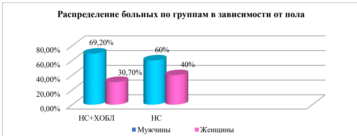
Рис. 2. Распределение больных по группам в зависимости от пола

При изучении половой структуры пациентов 1 и 2-группы было установлено, что НС чаще встречается у мужчин. В 1-й группе частота встречаемости заболеваний на 38,5% чаще отмечалось у мужчин и составило 69,2% и 30,7% соответственно. Во 2-й группе частота встречаемости заболевания на 20% чаще отмечалось у мужчин и составило 60% и 40% соответственно (рис. 2).