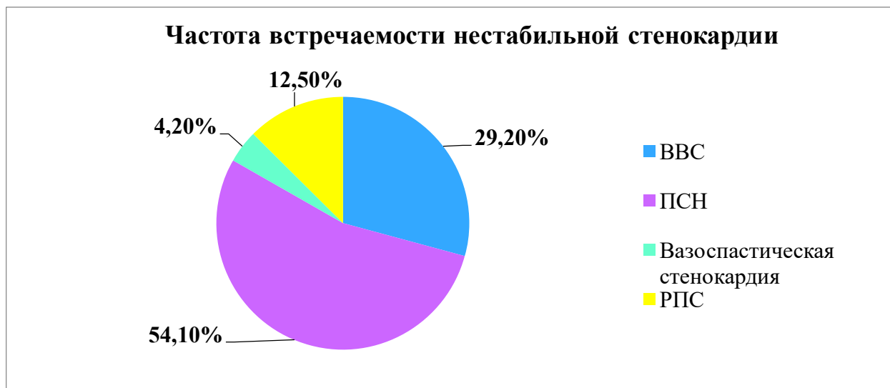
Рис. 2. Распределение больных по частоте встречаемости нестабильной стенокардии

прогрессирующая стенокардия – у 65 человек (54,1%), 3) вазоспастическая стенокардия – у 5 (4,2%), 4) ранняя постинфарктная стенокардия – 15 (12,5%), [10,14,29] (рис 2).