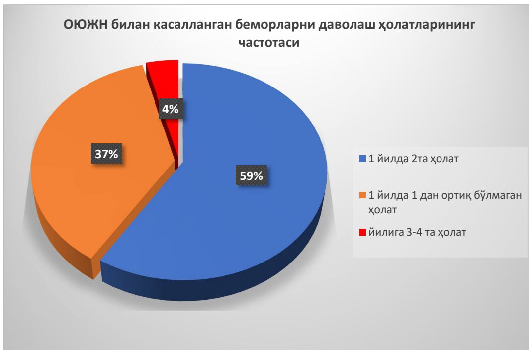
1-расм. ОЮЖН билан оғриган беморларни даволаш ҳолатларининг частотаси ҳақидаги саволга жавобларнинг тузилиши

ортопедларнинг тажрибаси ўртасидаги яққол боғлиқлик билан аниқланади. Иш тажрибаси ошгани сайин, бу саволга мусбат жавобларнинг частотаси ошади. Ушбу қонуният ОЮЖН билан оғриган беморларни даволаш ортопедик стоматологияда тегишли тайёргарлик, маҳорат ва клиник тажрибани талаб қиладиган мураккаб фаолият турига боғлиқ бўлиши мумкин. Бундан ташқари, ўтказилган статистик тадқиқотларимизда тасдиқланганидек, ушбу патологияга эга беморлар жуда кам учрайди. Бу ўз навбатида, кам иш тажрибасига эга бўлган шифокорлар амалда бундай беморларга дуч келиш имкониятига эга эмаслигини тушунтиради.