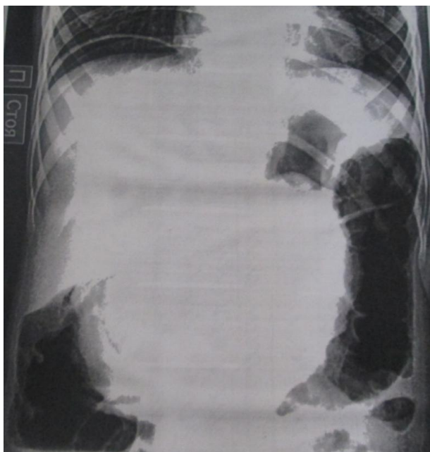
Расм 1. Қорин соҳаси умумий рентгенограммаси