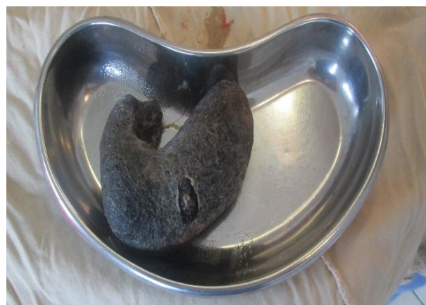
Расм 4. Трихобезоар кўриниши

Клиник мисол. Бемор Ф. 8 ёшда (касаллик тарихи №1854/407) Республика шошилич тиббий ёрдам илмий маркази Самарқанд филиали Шошилич болалар хирургияси булимга онаси сўзидан қорин соҳасидаги оғриққа, қусишга, тана ҳарорати кўтарилишига, қорин дам бўлишига, ҳолсизликка шикоятлари билан мурожаат қилди. Анамнезидан 1 ҳафтадан буён касал. Касаллиги ҳар ҳар вақт билан қусиш билан бошланган. Охириги 2 кунда қусиш кўпайган, қорин соҳасида кучайиб борувчи оғриқлар, тана ҳарорати кўтарилиши ва ҳолсизлик каби шикоятлар безовта қилган.