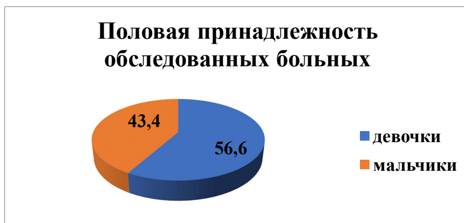
Рис.1. Половая принадлежность обследованных больных.

При анализе пола, среди этих больных преобладали девочки и составили 56,6% , чем 43,4%. мальчики (рис.1).