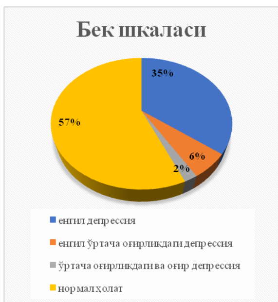
Расм 1. Хавотирли-депрессив касалликларнинг хусусиятлари

Яллиғланиш фаоллигининг оғриқ интенсивлигига кўшган ҳиссасини баҳолаш учун биз DAS28 ва унинг таркибий қисмлари ўртасидаги муносабатни турли хил сўровномаларга мувофиқ оғриқ хусусиятларига баҳоладик. DAS28 нинг оғриқ синдромининг турли параметрлари билан ўзаро боғлиқлиги аниқланди. Шу муносабат билан DAS28 нинг турли хил таркибий қисмлари ва оғриқ синдроми параметрлари ўртасидаги боғлиқлик таҳлил қилинди. Оғриқнинг оғирлиги объектив маълумотлар кўра оғриқли бўғинлар сони, шишган бўғимларнинг сони ва эритроцитларнинг чўкиш тезлиги билан боғлиқ эмаслиги аниқланди. Шу билан бирга, бемор томонидан субъектив равишда баҳоланган DAS28 компоненти, Мак-Гилл сўровномасининг ( r=0,36 ), сурункали оғриқ ( p=0,44 ), корреляцион таҳлил NADS шкаласи бўйича Мак-Гилл ва Ван Корфф анкеталари кўрсаткичлари ва ташвиш даражаси ( r=0,26 p=0,01 ) ва депрессия ( r=0,28 ) ўртасидаги тўғридан-тўғри боғлиқликни аниқлади, анкета CES-D ( r=0,4 ), Бек шкаласи ( r=0,3 ). Хавотирли-депрессив бузилишларга чалинган беморларда НАQ сўровномасида функционал фаоллик кўрсаткичи юқори бўлганлиги қайд этилди.