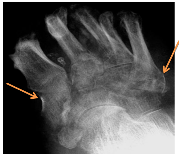
Расм. 2. Бемор, 65 ёшда. Қабул қилинган пайтдан бошлаб 14 кундан кейин ўнг оёқ чултогининг рентгенограммаси—тарсал - metatarsal бўғим суякларини зарарланиши