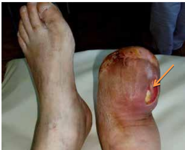
Расм. 1. Бемор, 65 ёш, ДПС, ўнг оёқ чўлтоги флегмонасини очгандан кейинги ҳолат. Ўнг оёқ чўлтогининг шиши, деформацияси ва гиперемияси, ўнг оёқнинг орқа қисмидаги грануляцион яра