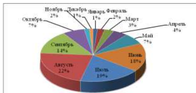
Расм 2. Мавсумийлик (%)

Кузатувга олинган беморларимизни ЎИИ томонидан қўзғатиладиган ичак касалликлари билан йил давомида касалланиш ҳолатини таҳлил қилганимизда (2-расм):