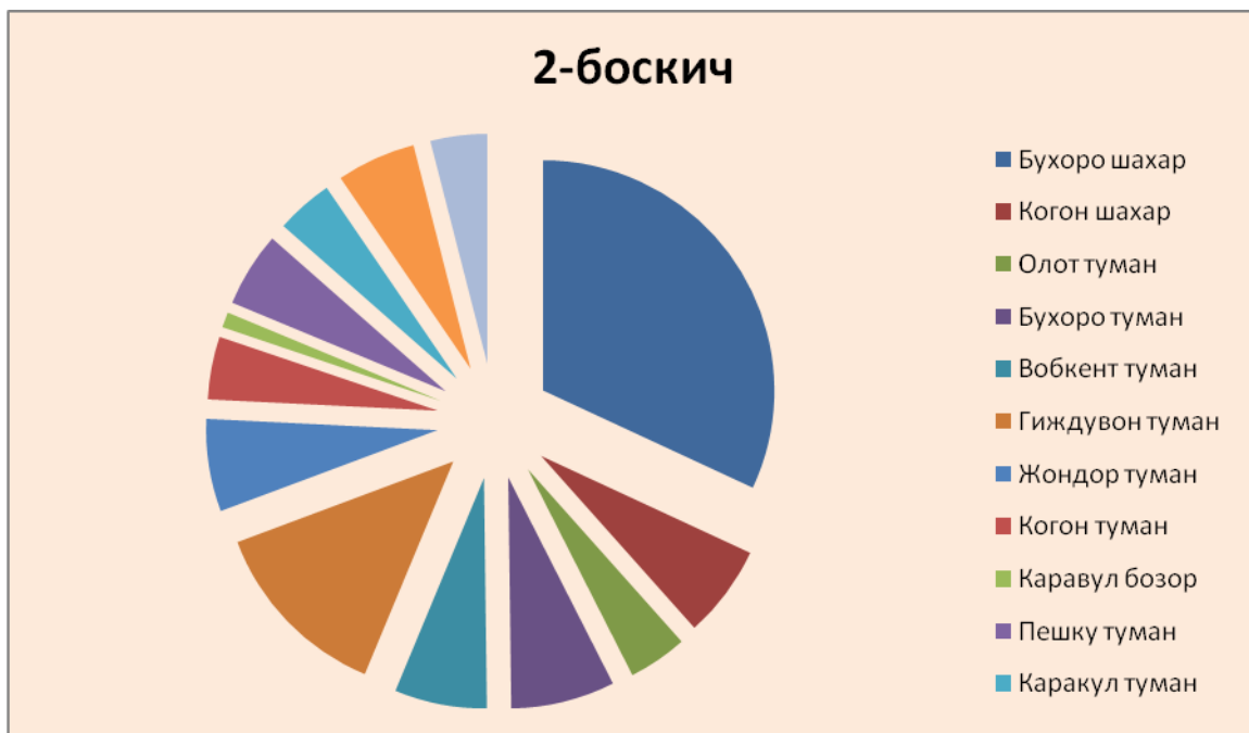
Расм 2. 2-Босқичда олинган маълумотлар