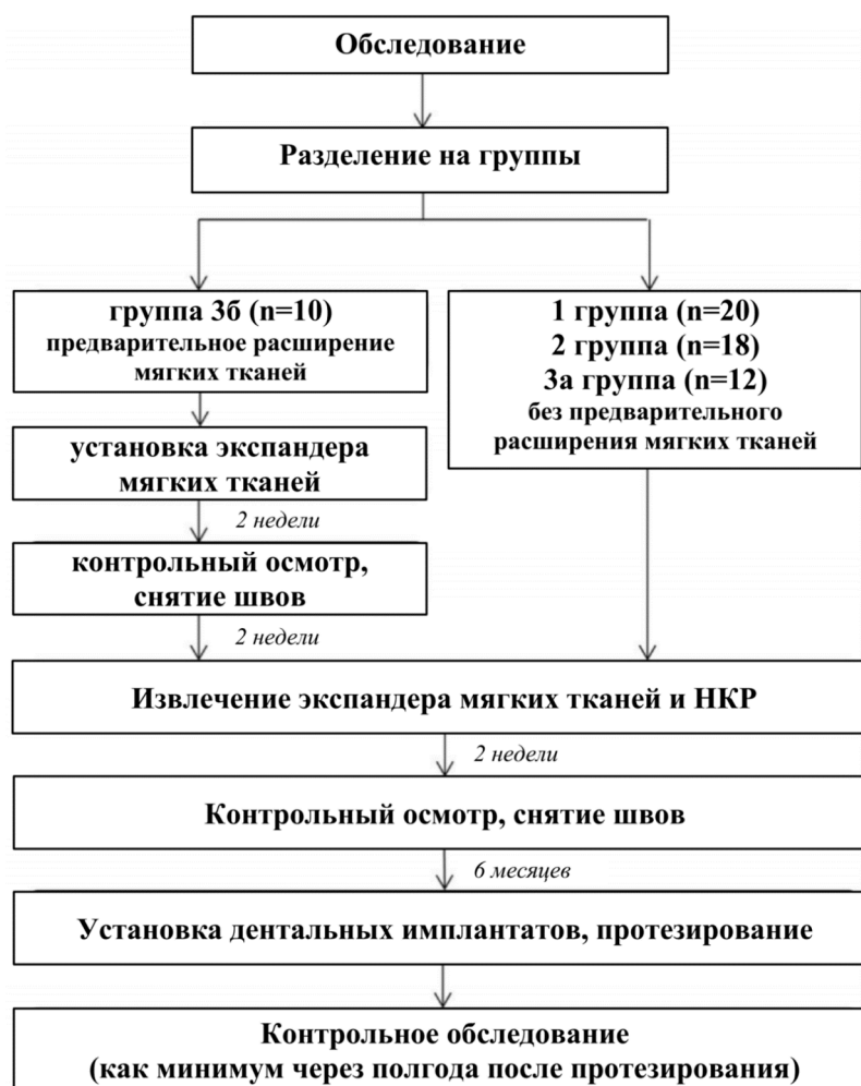
Рис. 1. Этапы исследования и проводимого лечения

Проводилось изучение и анализ жалоб, анамнеза. Выявляли этиологию дефектов, хронологию проводимой терапевтической и ортопедической помощи, выясняли ранее перенесенные заболевания.